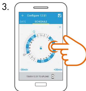
3. Schaltzeiten auswählen und speichern