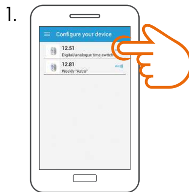
1. In der FINDER TOOLBOX App einen Produkttyp wählen